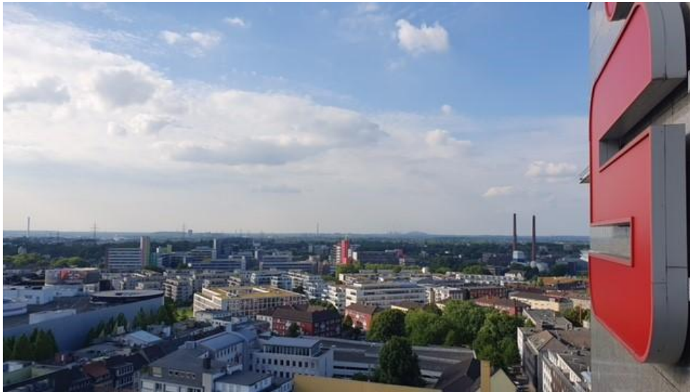
Jahreshauptversammlung unter dem roten S der Sparkasse mit tollem Blick über Essen

Jahreshauptversammlung der Verkehrswacht Essen in den Räumen der Sparkasse Essen