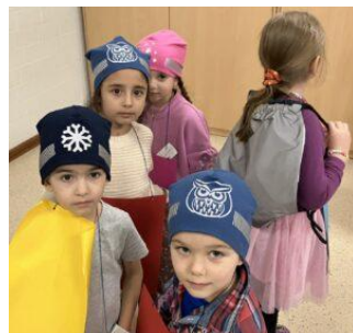
Links: Mützen, reflektierende Beutel, kindgerechte Motive und witzige Motiv-Reflektoren