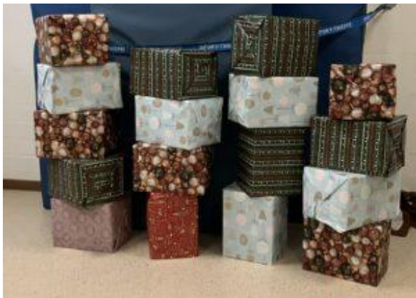
Fast wie bei einer Bescherung warteten die Sichtbarkeitsmaterialien weihnachtlich verpackt auf ihre Verteilung.

Uwe Paulukat , Abteilungsleiter Pädagogische Einrichtungen Stadt Essen, bedankte sich bei der Verkehrswacht für die gleichermaßen schönen wie sinnvollen Materialien, die den Kindern und deren Sicherheit zugute kommen.