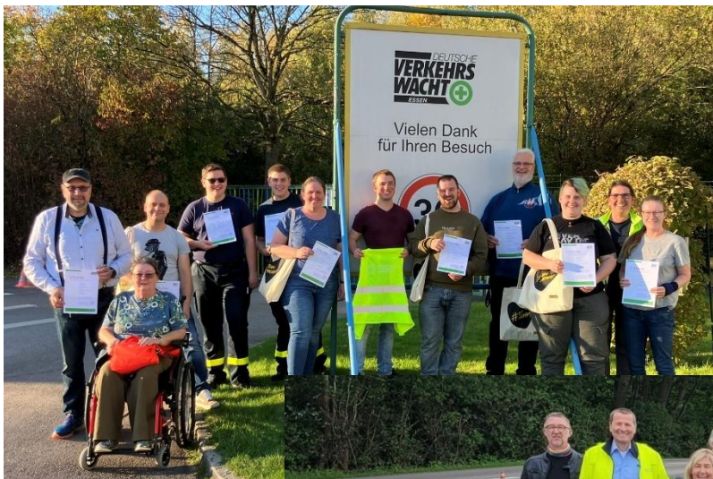
PKW-Sicherheitstraining für Ehrenamtler über die Deutsche Stiftung Engagement und Ehrenamt.