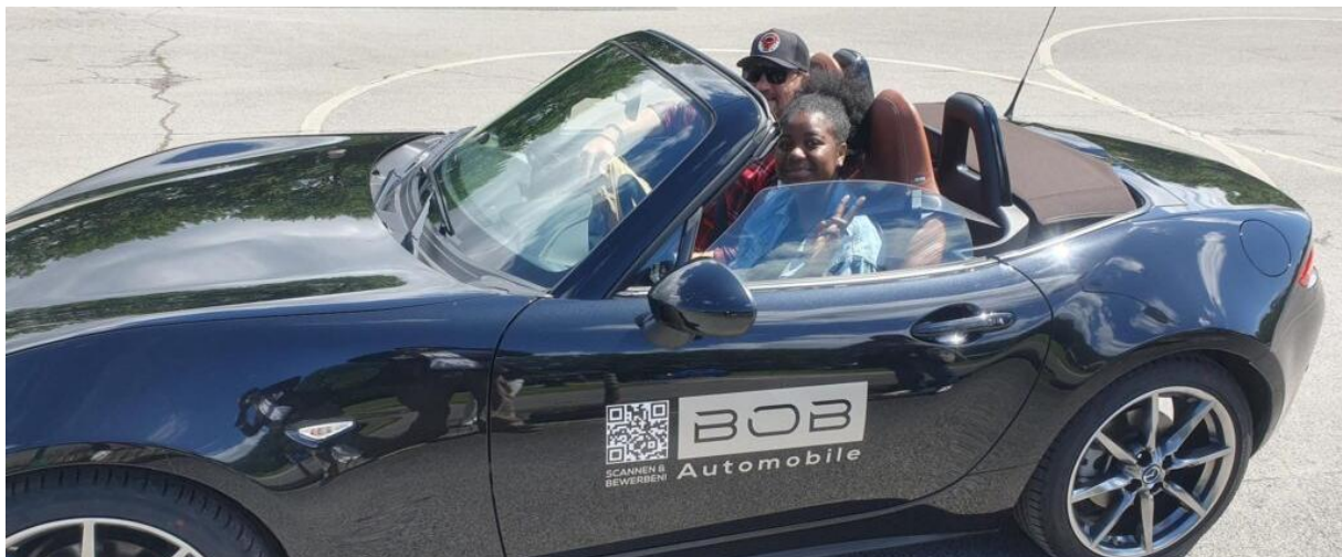
Erste Fahrversuche im Schonraum auf dem Verkehrsübungsplatz machen Spaß und zeigen den Kindern, wie anspruchsvoll es ist, ein Auto zu fahren und dabei den Überblick zu behalten.

Beim 1. BOB-Familien-Verkehrssicherheitstag am 15.06.2024 auf dem Verkehrsübungsplatz der Verkehrswacht Essen durften Kinder ab 12 Jahren und 1,50 m Körpergröße selbst Auto fahren. Begleitet wurden sie von einem erfahrenen Fahrlehrer oder Fahrtrainer. Um einen geregelten Ablauf zu sichern, hatten die Eltern ihre Kinder vorher über ein Buchungstool angemeldet. Dabei konnten sie sogar wählen, ob die Fahrübung mit einem Mazda MX 5 oder einem Hyundai Tucson stattfinden sollte.