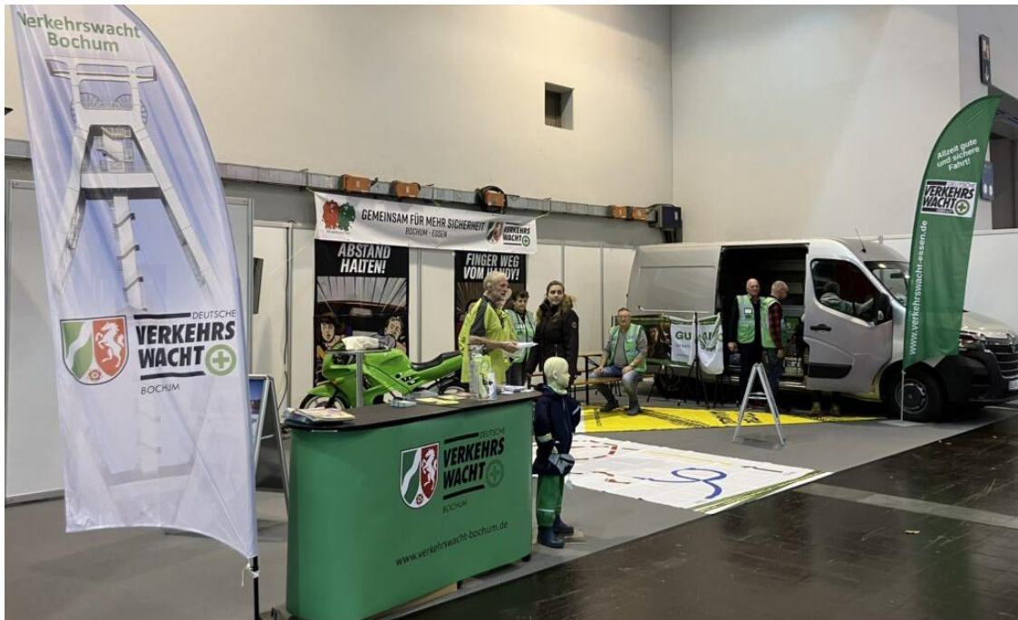
Der große Stand bot Platz für verschiedene Aktionen, benötigte allerdings auch bis zu 10 Personen, um alle Geräte zu besetzen und die Besucher fachgerecht zu informieren.