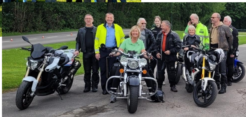
Motorradsicherheitstraining zum Saisonauftakt.