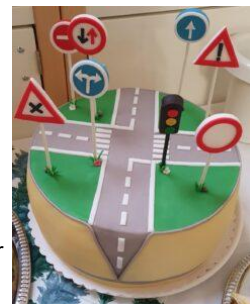
Rechts: Passend zum Thema eine wunderschöne und sehr leckere Torte.

Ein ganz herzliches Dankeschön geht an die Leitung, die Erzieherinnen und die Kinder der Kita Im Mühlenbruch für die Ausrichtung dieses Termins und an Frau Andrea Schuster für die Organisation im Hintergrund.