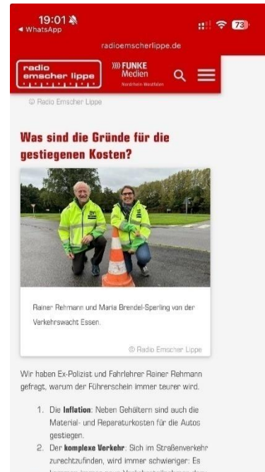
Große Reichweite für den Verkehrs-übungsplatz auf der Internetpräsenz von Radio Emscher Lippe und auf Instagram