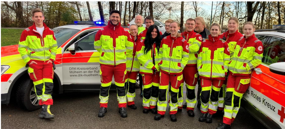
Junge Menschen in besonderer Mission. PKW-Sicherheitstraining für die „Bufdies“ des DRK Mülheim

Das Deutsche Rote Kreuz Mülheim konnten wir kurzfristig darin unterstützen, die jungen Menschen, die den Bundesfreiwilligendienst ableisten, zu schulen, damit sie von Beginn an sicher mit den besonderen Dienstfahrzeugen des DRK umgehen können.