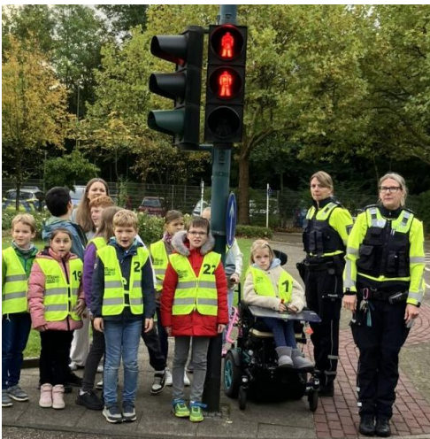
Auch an einer Kreuzung, die durch eine Ampel geregelt ist, müssen die Kinder das richtige Verhalten lernen.

Doch plötzlich wurden die Kinder unruhig. „Da ist Eeeemiiii!!!“. Das Maskottchen kam in aller Seelenruhe heranspaziert, ging einfach so über die Straße oder kam gar mit der Rikscha angefahren und stieg mitten auf der Straße aus, ohne auf den Verkehr zu achten. „Neeeeein“ und „Aaaaachtung“ hallte es durch die Jugendverkehrsschule und Emil blieb ganz erschreckt stehen. Was war denn los? Hatte er etwa etwas falsch gemacht? Das erklärten ihm die Kinder, nahmen ihn an die Hand und zeigten ihm, wie man richtig die Straße überquert. „Links, rechts, links, rechts“ riefen die Kinder im Chor und alle überquerten sicher die Straße, inklusive Emil, der sich mit „High five“ bei den Kindern bedankte und alle abklatschte.